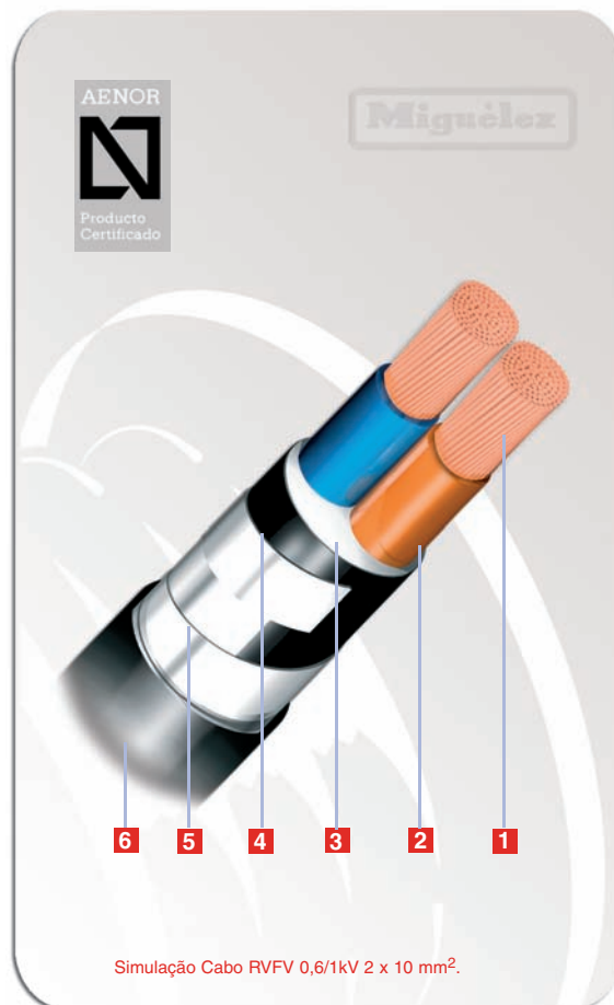
Simulação Cabo RVFV 0,6/1kV 2 x 10 mm 2 .

Temperatura mínima permitida para o desenrolar de cabos durante a sua instalação e montagem de acessórios: 0°C